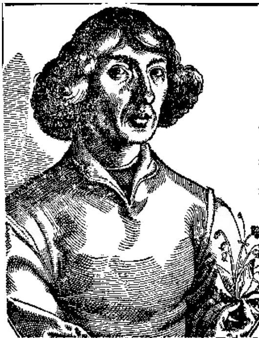
Portret wyk. przed 1584 r. (Tobiasz Stimmer)